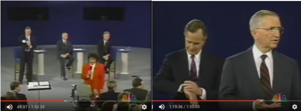
Fig. 1 og 2: I hvert fald to gange under debatten kiggede Bush på sit ur, hvilket tolkes som et uheldigt signal. På fig 1 her er det fanget på et oversigtsbillede mens ordstyreren (i rødt) lægger op til et spørgsmål fra salen. På fig 2 er Ros Perot i færd med at tale, men kameraet sørger for at holde Bush med inde i baggrunden.

https://www.youtube.com/watch?v=m6sUGKAm2YQ&t=3826s