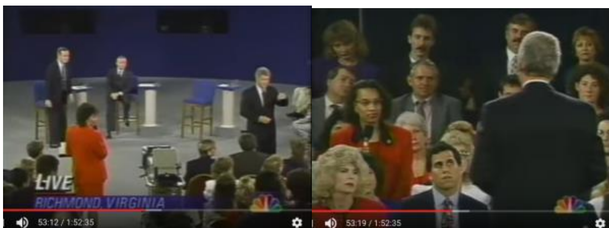
Fig. 7 og 8: Clinton går helt bogstaveligt den spørgende blandt publikum i møde og sørger for at komme i en slags personlig dialog med hende først, før han svarer mere generelt.

Hvad der imidlertid er lidt påfaldende her er, at han omhyggeligt specificerer at det er en "black church". Det turde vel være mindre relevant. Men en tolkning ud fra sammenhængen kunne være, at denne "farvesætning" falder Bush ind, fordi han ser eller er påvirket af, at den ihærdigt spørgende kvinde også er "black". En sådan mekanisme kunne naturligvis også være virksom i et radiostudie, der er ingen grund til at tro at radioen i sig selv udviskede eller demokratiserede i forhold til race, køn eller for den sags skyld påklædningsstil, men der er al mulig grund til at være opmærksom på de visuelle retoriske muligheder i tv-mediet.