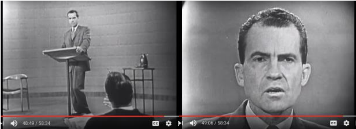
Fig. 6 og 7. Her er et eksempel på en lidt mere heldig eller kamerabevist optræden, som også understøttes af produceren: Nixon får et kritisk spørgsmål fra en journalist som sidder skråt foran ham, men vender sig i svaret straks energisk mod kameraet lige foran ham, som viser et frontalt nærbillede.

Det er naturligvis almindelig kendt, at medierne kan vælge at fremhæve eller skjule visse træk eller sider af en politikers personlighed osv – fx er det jo nu kendt at Kennedy faktisk havde mange ryg-smerter, men at dette blev forsøgt holdt skjult eller neddæmpet af hans stab både under og efter valgkampen. Men det er ikke så tit denne mediemæssige magt til at skjule eller fremhæve også reflekteres på mikro-niveauet for et enkelt programs konkrete klipning eller brug af kameravinkler.