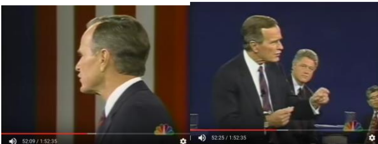
Fig. 5 og 6: Bush vender sig bort fra den ihærdigt spørgende kvinde og begynder på en lidt anden historie, som ikke virker helt relevant. I baggrunden ses Clinton, som holder en seriøs maske.

Et mindre vellykket tv-øjeblik for Bush kommer, da alle tre kandidater bliver spurgt af en kvindelig publikummer, hvordan den økonomiske krise har påvirket dem personligt, og hvis de ikke er blevet personligt påvirket, hvordan de så sige, de kan hjælpe "the common people"? Kvinden (hjulpes af ordstyreren) insisterer på den personlige vinkel, da Bush begynder at snakke lidt mere i generelle vendinger om det bekymrende ved krisen. De følgende kameraskud af Bush synes at vise, at han efterhånden bliver irriteret, ja nærmest ønsker at distancere sig fra den spørgende, og han lyder også lidt snurrende i stemmen.