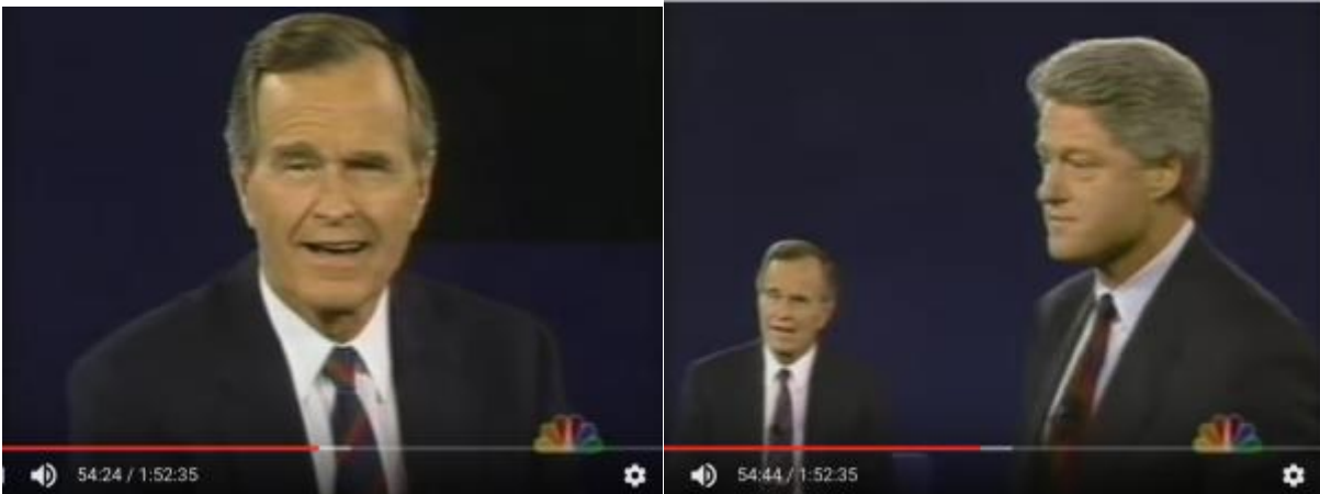
Fig. 11 og 12: På nærbilledet her er Bush ikke ved at sige noget, men han fanges af kameraet mens han sidder og lytter med åben mund til Clintons velmurte retorik. Senere sørger et andet kamera omhyggeligt for at holde Bush (stadig med et ret fjoget udtryk) med inde i billedet i baggrunden, mens Clinton taler i forgrunden.

Da Clinton fortsætter og taler i lidt mere generelle vendinger om krisen, og hvad han gerne vil gøre for at imødegå den, klippes der ikke mere tilbage til den spørgende kvinde. Til gengæld klippes på et tidspunkt til et lytterbillede (reaktionsskud) af Bush, som man har anet i baggrunden bag Clinton. I nærbilledet ses Bush sidde med et i min fortolkning noget fjoget og nærmest opgivende udtryk, som om han ved at lytte til Clinton tænker noget i stil med: "Ej, ham kan jeg slet ikke hamle op med".