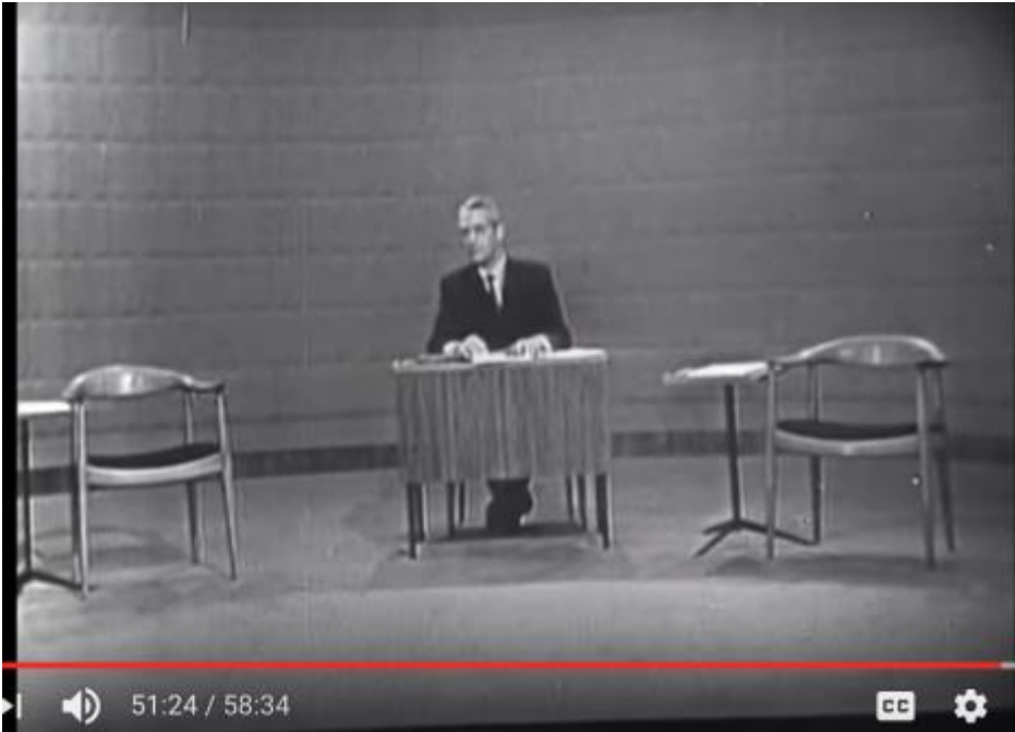
Fig. 8. Totalindstillingen, hvor ordstyreren spørger ud i rummet om, hvor meget tid der er til resuméet. Stolene ved siden af ham er tomme, fordi begge kandidater her står op uden for billedet. Ligesom ved indledningsbilledet kan det bemærkes, at kameraet her ikke er i vater. Det ville dog nok være en overfortolkning at tillægge det betydning, at ordstyreren synes at hælde mest til Kennedys side.

Hen mod slutningen af dette program (tidskode 51:13-29) kommer en – set med nutidens øjne – måske lidt overraskende og nærmest meta-kommunikativ afbrydelse, idet ordstyreren set i en totalindstilling pludselig spørger ud i rummet, om han må få ”the summation time, please”. Og lidt efter svarer en mandestemme, off-screen og med meget rumklang, (formodentlig produceren), at der er plads til 3 minutter og 20 sekunders resumé. Jeg finder denne ”regi-bemærkning”, eller hvad vi nu skal kalde det, ret charmerende og tidstypisk (i dag ville ordstyreren nok have fået besked via en øresnegl eller en elektronisk skærm), men samtidig er det også en slags reportage-markør og selv-understregning af programmets karakter af at være ”live” broadcast, hvor indholdet opstår i delvist uforudsigeligt samspil med deltagerne.