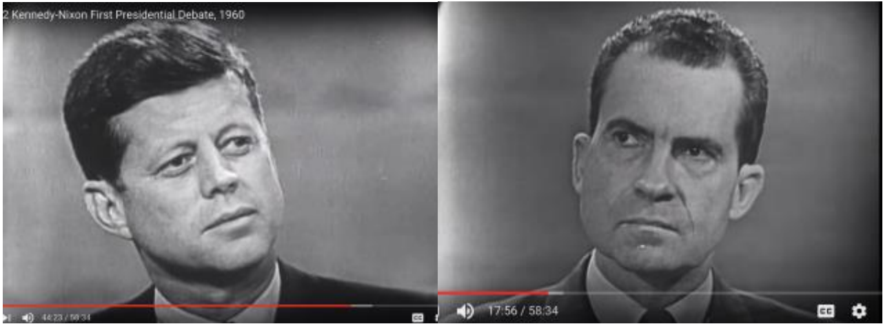
Fig. 2-3 Nærbilleder af Kennedy og Nixon, mens de lytter til modparten, her begge med hvad der kan se ud som en passende statsmandagtig ethos-fremtoning. Still-billederne her snyder dog noget, for mens Kennedy forholder sig roligt, så flytter Nixon sig i flere sekvenser meget uroligt, har flakkende øjne osv.

https://www.youtube.com/watch?v=gbrcRKqLSRw