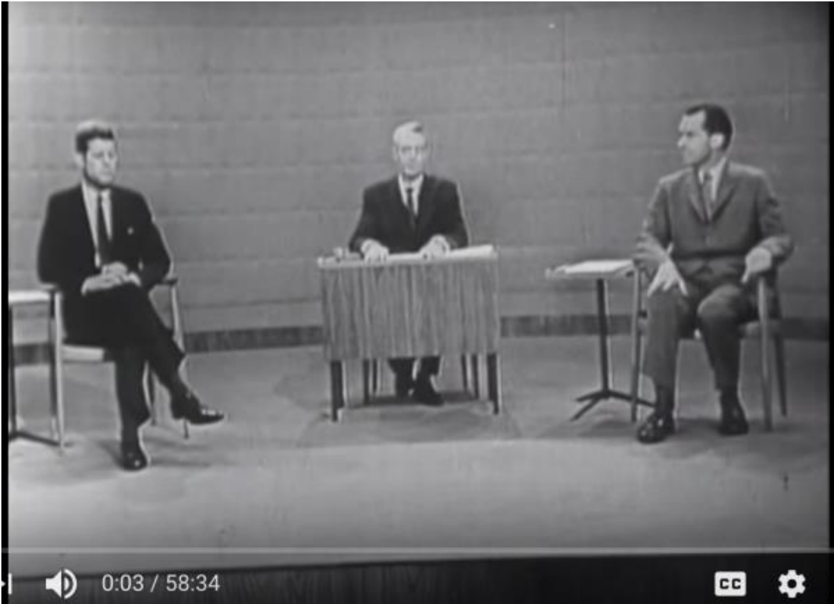
Fig. 1 Oversigtsbilledet i starten af debatten mellem Kennedy og Nixon fra 1960 - her fra https://www.youtube.com/watch?v=gbrcRKqLSRw

For nu at starte med begyndelses-billedet af tv-duellen mellem Kennedy og Nixon (fig. 1) så kan man allerede her lægge mærke til forskellen på de to kandidaters måde at sidde på. Kennedy til venstre ser forholdsvis rolig og afslappet ud, hvorimod Nixon til højre sidder i en noget akavet stilling. Som tv-seer kan man altså allerede her få det indtryk, at Nixon er nervøs og mindre "statsmandagtig" end Kennedy (selv om Nixon på dette tidspunkt faktisk måtte siges at have mest erfaring, bl.a. som vicepræsident).