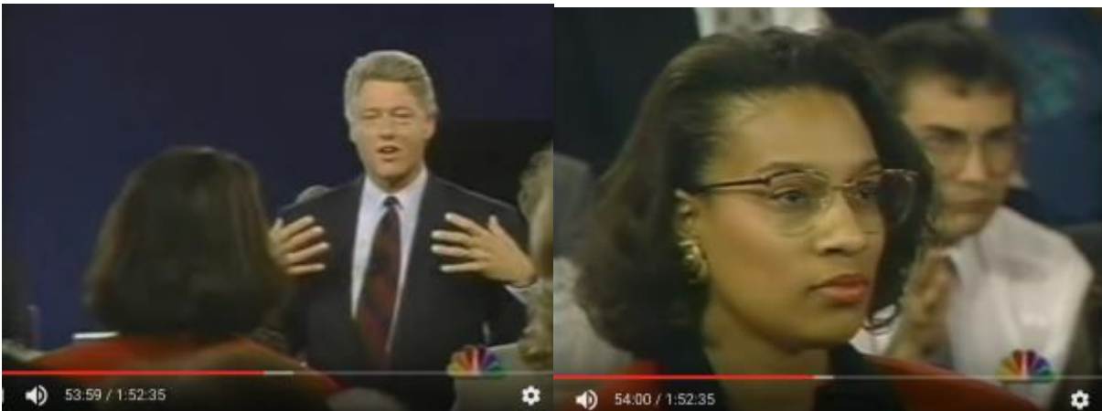
Fig. 9 og 10: Kamerafolkene og produceren viser os fra flere forskellige vinkler, hvor tæt Clinton er på den spørgende tilskuer, og vi ser hende også nikke anerkendende mens Clinton er i gang med at svare – eller i hvert fald er i gang med at tale. Kameravinklerne skifter i denne udsendelse så meget, at den ellers så konventionelle 180 graders regel overtrædes, hvilket kan tolkes som et mere eller mindre bevidst forsøg på at ophæve skellet (kendt fra traditionelt teater) mellem politikerne på scenen og publikum i salen.

heller ikke han direkte på spørgsmålet om, hvordan han personligt et blevet (økonomisk) påvirket af krisen, men hans kropssprog og hele henvendelsesstil er ganske anderledes imødekommende end Bush's var lige før.