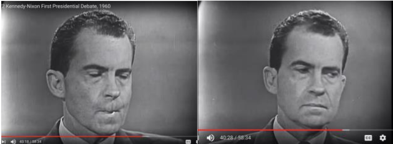
Fig 4. og 5. Her har kameraet/produceren fanget Nixon i en lytterposition (eller et "reaktionsskud" om man vil), hvor han ser væk fra Kennedy og ordstyreren og altså synes at vende sig bort fra debatten, samtidig med at han bider sig nervøst/anstrengt i læben og flytter uroligt på sig. https://www.youtube.com/watch?v=gbrcRKqLSRw

De indklippede reaktionsbilleder og deltagernes forskellige lyttende (eller nervøse) attituder er naturligvis ikke noget, man kunne høre i radioreportagen. Men det er heller ikke nødvendigvis noget man ville have lagt mærke til, hvis man selv havde været til stede i salen og måske ikke havde kigget på Nixon i netop disse øjeblikke. Så tv-mediet har magt til at fremhæve visse træk, som måske ellers ikke ville blive bemærkede. Tv kan vise os "mere", end vi ellers ville have set (er det så "mere end virkeligheden"?). Og det hører med, at tv-mediet også har magt til at skjule visse træk – fx kunne det jo være, at Kennedy også havde øjeblikke med nervøse trækninger, men at de bare ikke blev "fanget" af kameraerne eller produceren.