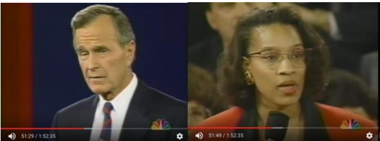
Fig. 3 og 4: Bush kommer til at fremstå meget irriteret, da en kvinde insisterer på det personlige i spørgsmålet om hvordan han selv, "personally", er blevet påvirket af krisen.

Det samlede udtryk fra en tv-debat, som man måske kunne kalde for "tv-retorikken", handler således ikke kun om, hvad man siger, mens man er på, men også om, hvad man gør, når man tror, man ikke er på, men alligevel bliver fanget af et kamera og af produceren. Både fotografens og producerens indsats er her væsentlig for, hvad der formidles videre, det er ikke kun deltagerne på scenen, som bestemmer.